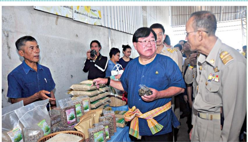
☑ ข้าวอินทรีย์... นายประภัตร โพธสุธน รัฐมนตรีช่วยว่าการกระทรวงเกษตรและสหกรณ์ พร้อมคณะ ลงพื้นที่ตรวจเยี่ยม กลุ่มข้าวอินทรีย์ศรีสุพรรณ ที่บ้านวังพลับใต้ ต.มดแดง อ.ศรีประจันต์ จ.สุพรรณบุรี ซึ่งผลิตข้าวแบบอินทรีย์โดยไม่ใช้สารเคมีทางการเกษตรทุกชนิด